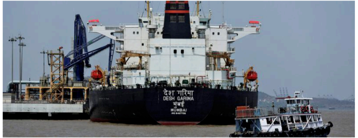
FREE FLOW. Of the 11 ships, there is one foreign-flagged crude oil tanker and six foreign-flagged bulk carriers carrying fertilisers (FILE PHOTO)

Responding to the withdrawal of sanctions on Iranian petroleum products by the US as part of the peace deal, the MEA said it is monitoring the developments in West Asia and that its energy