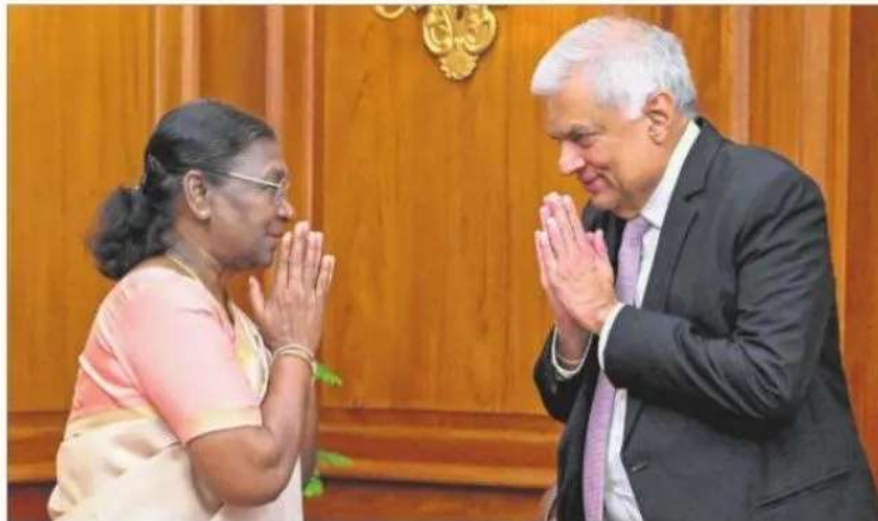
SKILFUL: President Wickremesinghe (right) has been steering his country away from an economic disaster.

The major change that the presence and actions of the IPKF in Sri Lanka in the 1980s achieved was that it left Sri Lankans convinced that India was committed to their unity and territorial integrity despite the ethnic conflict which led to a flow of Tamil refugees to Tamil Nadu. India now looks forward to Sri Lanka fulfilling its assurances on giving its Tamils in the country's North-east a due say in the country's democratic institutions. As