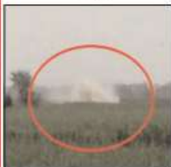
वेभव न्यूज़ ■ वागपत

जागोस गांव में बुधवार तड़के यमुना नदी के बीच आईजीएल कंपनी की गैस पाइप लाइन फट गई, जिसके बाद नदी के पानी में बवंडर उठ गया और पानी 25-30 फीट ऊपर तक उठ गया। अधिकारियों ने मौके पर पहुंचकर पूरे मामले की जानकारी ली और पाइप लाइन से गैस की सप्लाई को बंद कराया।