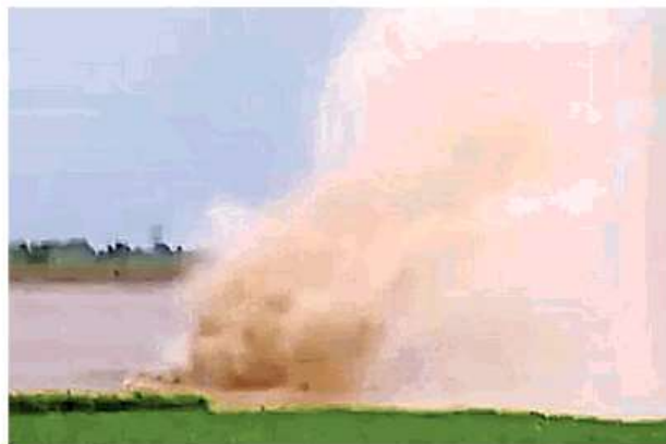
पाइपलाइन लीक होने से कई फुट ऊंचा उठा यमुना का पानी