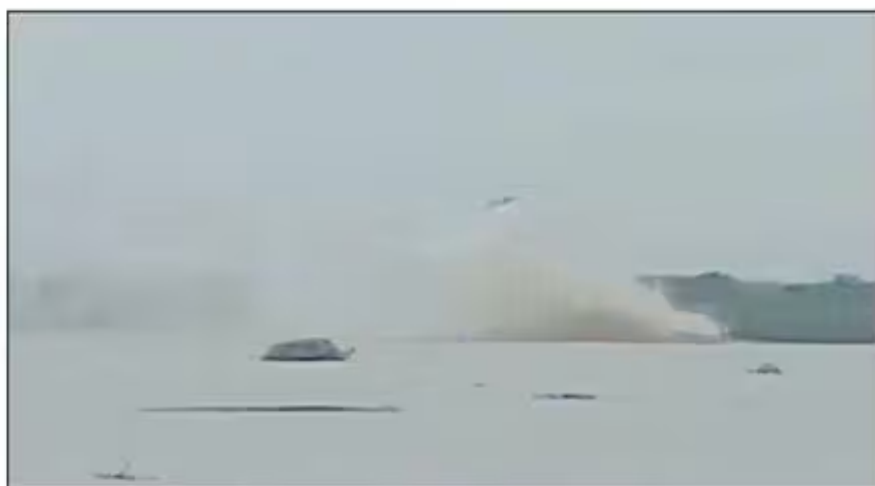
बागपत के पास यमुना में पाइपलाइन फटने के बाद उठती लहरें। • वीडियो गैब

लोगों ने धमाके का वीडियो सोशल मीडिया पर डालना शुरू किया जिसके बाद स्थानीय अधिकारी व आईओसीएल (इंडियन ऑयल कॉर्पोरेशन लिमिटेड) कंपनी के आलाधिकारी मौके पर पहुंच गए। सेफ्टी