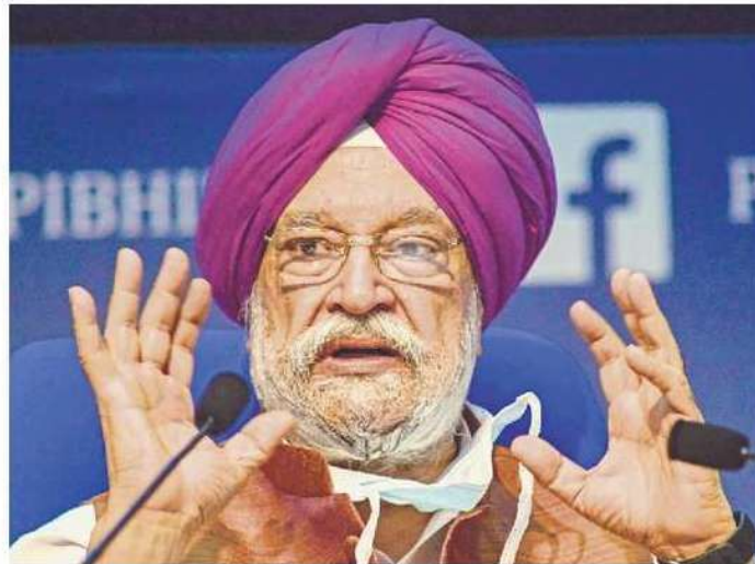
Petroleum and natural gas minister Hardeep Singh Puri.

S&P Global Commodity Insights in a report on 30 October said Indian refiners are likely to import crude oil from Venezuela at a dis-